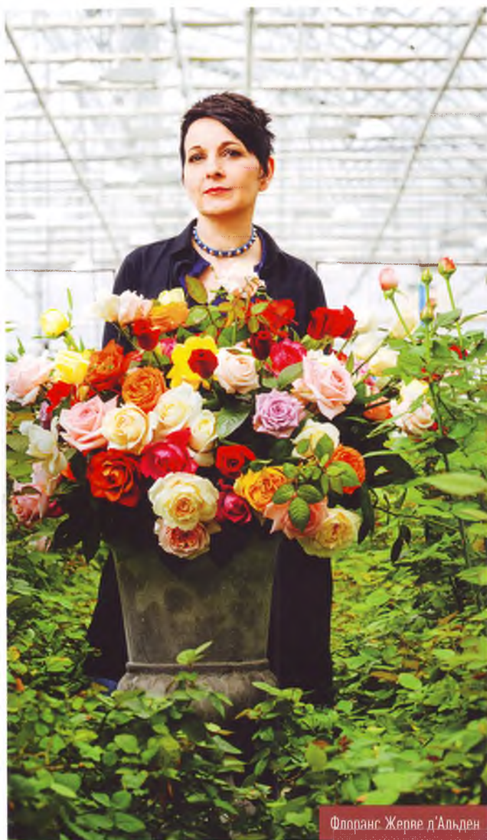
Флоранс Жерве д'Альден