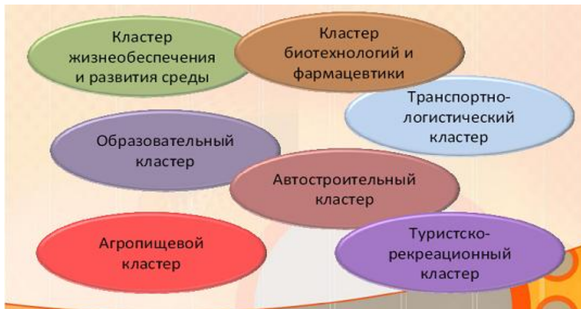
Рис. 1. - Создание и развитие кластеров на территории Калужской области

Значительно увеличить объем иностранных инвестиций в экономику региона помогла продажа такого продукта как индустриальные парки. Создание индустриальных парков с качественным предложением площадок, оборудованных необходимой инженерной инфраструктурой для размещения новых производств, обеспечивает сбалансированную индустриальную застройку региона, согласованную с развитием транспортной, инженерной и социальной инфраструктур, с учетом перспектив развития трудовых ресурсов.