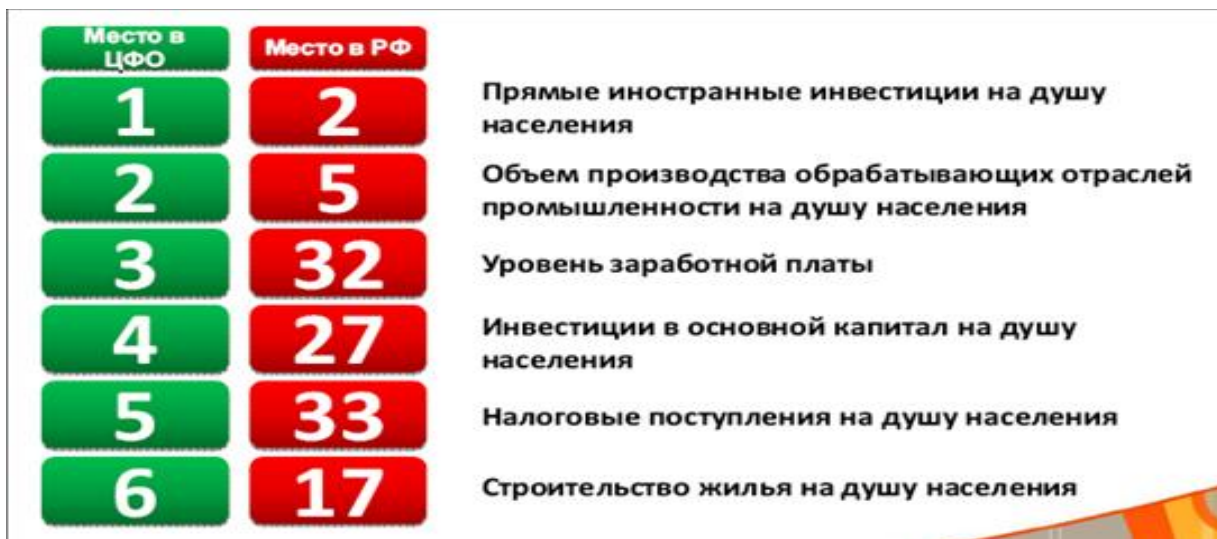
Рис. 2. - Калужская область — лидер новой индустриализации

Определены направления дальнейшего совершенствования организационно-экономического механизма привлечения иностранных инвестиций в инновационное развитие региона, а также предложен ряд мер эффективного противостояния угрозам критического характера - как внешним, так и внутренним. Обоснована необходимость: